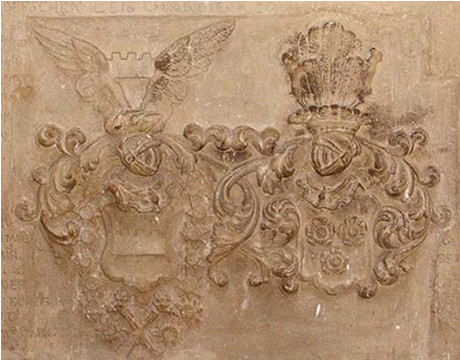
Парный герб графа Карла Густва Левенвольде и его жены Шарлотты фон Розен.