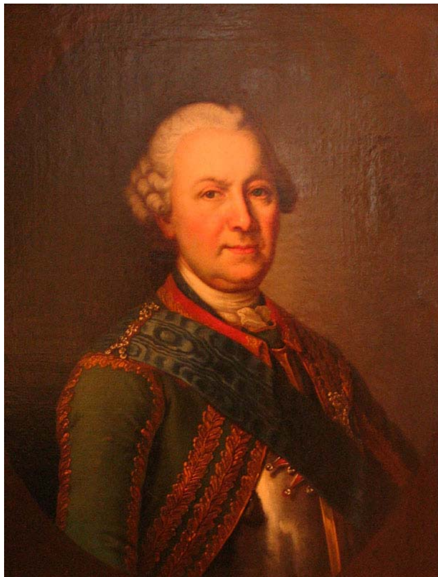
Рис. 2. Б.Х. Миних