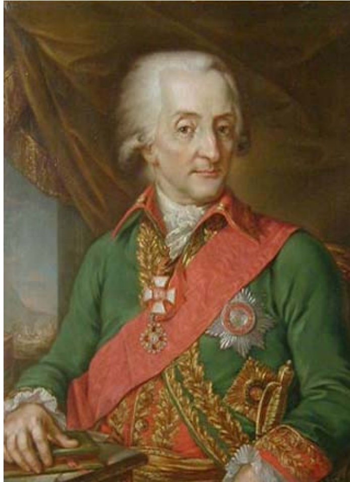
Рис. 3. И.Е. Ферзен (Художник А. Жданов, 1795 г.).