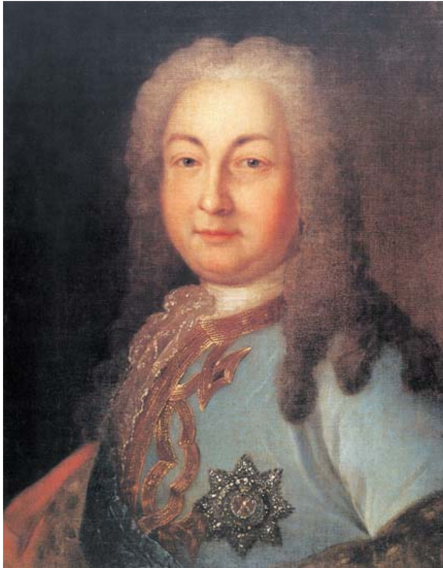
Рис. 1. А.И. Остерман