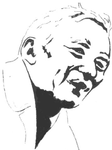
Рисунок Л.Н. Большева

«Большев пишет правой и левой рукой одинаково и каллиграфически» – это тоже было известно всем, кто хоть раз посетил его лекцию. Лектор менял руку часто, что никак не сказывалось на записанном мелом тексте. Его не надо было просить, как иногда просили студенты лекторов, «писать слева направо и сверху вниз».